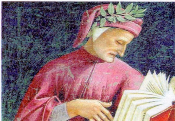
Dante Alighieri, affresco di Luca Signorelli (databile 1500-1504). Cappella di San Brizio nel Duomo di Orvieto.