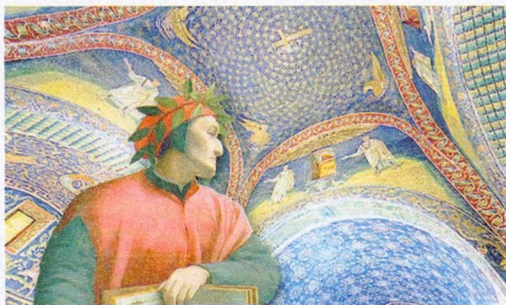
La luminosa bellezza dei mosaici di Ravenna fu d'ispirazione a Dante nel portare a termine la cantica del Paradiso.

Manuela Mambelli , Centro Dantesco - Ravenna