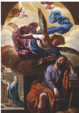
“Il sogno di S. Giuseppe” di A. Palomino. Chiesa di San Ginés de Arlés, Madrid.

P apa Francesco ha indetto un anno speciale dedicato a san Giuseppe, nel 150° anniversario della dichiarazione del suo patrocinio sulla Chiesa universale. Conosciamo Giuseppe per le notizie forniteci dai Vangeli dell'infanzia di Gesù (secondo la Chiesa cattolica gli elementi forniti dagli apocrifi sono storicamente inattendibili). I Papi sono intervenuti spesso per promuovere la devozione liturgica di san Giuseppe. Hanno esteso a tutta la Chiesa la celebrazione del 19 marzo (oggi con il grado di solennità) e, successivamente, istituito la memoria del 1° maggio, nella quale Giuseppe è proposto come modello di lavoratore (Gesù, «il figlio del falegname»).