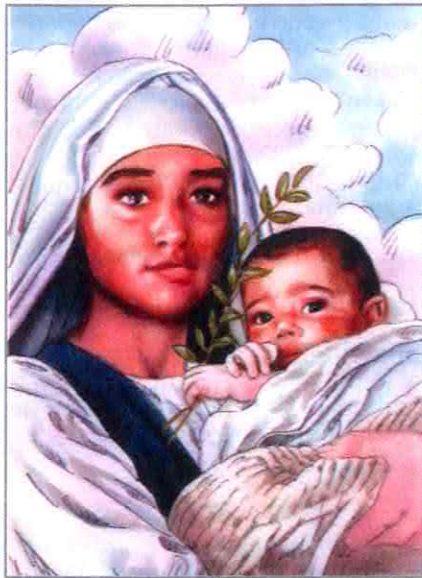
Alla Vergine Maria, Madre di Dio e della Chiesa, chiediamo che ottenga da Dio il dono della pace.