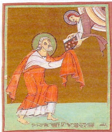
L'apostolo Giovanni riceve la rivelazione dall'angelo (Ap 1,1-8). Immagine tratta dal libro Ja, ich komme bald , Informationszentrum Berufe der Kirche, Friburgo 1985.

Anche la nostra comunità viene guidata dallo Spirito a comprendere questo linguaggio: nel mondo c'è una continua lotta tra il bene e il male che coinvolge la nostra persona, la famiglia, la società. Le forze del male, che anche oggi si presentano sotto diversi nomi e immagini (come nell'Apocalisse), sono destinate alla sconfitta dalla parola di vita di Gesù e dalla sua croce, sulla quale splende già la vittoria pasquale dell' Agnello (così è chiamato Gesù in questo libro). don Primo Gironi, ssp, biblista