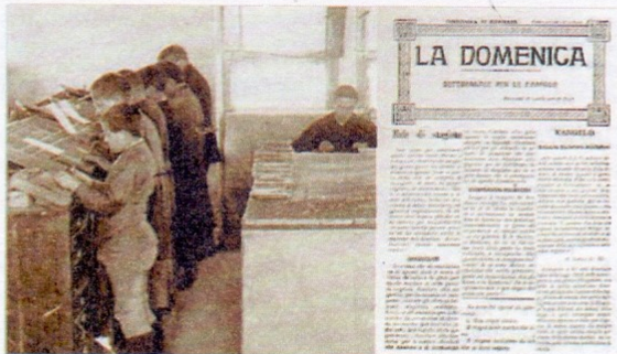
A destra: uno dei primi numeri de «La Domenica». A sinistra: i giovani della Scuola Tipografica al lavoro.