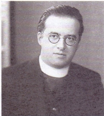
Georges Lemaître unanimemente considerato, con lo scienziato russo Aleksandr Fridman, il padre di quella che verrà chiamata «teoria del Big Bang».