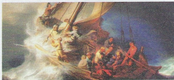
Gesù disse loro: «Perché siete così paurosi? Non avete ancora fede?» (cf. Mc 4,35-41). Immagine: "Cristo nella tempesta sul lago di Galilea" (partic.), Rembrandt (1606-1669).