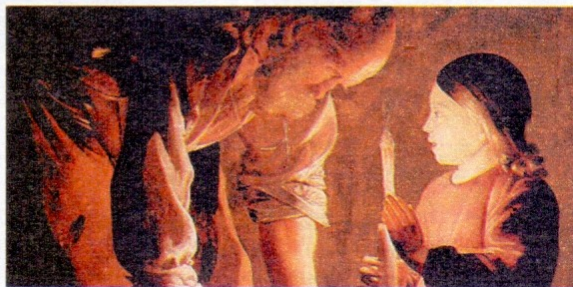
50 "San Giuseppe falegname" di Georges de La Tour (Museo del Louvre, olio su tela, 1642 circa).

O sposo castissimo di Maria Vergine , tu hai amato e messo al centro Maria e Gesù. La tua felicità è stata il donarti. Prega per tutti i chiamati al matrimonio, al sacerdozio ministeriale e alla vita consacrata, perché giungano alla maturazione del dono di sé, facendosi segno della bellezza e della gioia dell'amore. Da te imploriamo la grazia delle grazie: la nostra conversione. Patrono della buona morte, prega per noi. Amen!