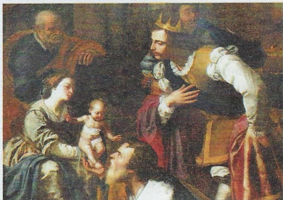
ADORAZIONE DEI MAGI, A. GENTILESCHI (1593-1654).